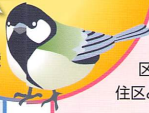
区の鳥 シジュウカラ

目黒区では、区民のみなさんが地域に関心を持ち、地域の人と人とのつながりを基にして助け合い支えあうことができる住み良い地域社会づくりを進めています。